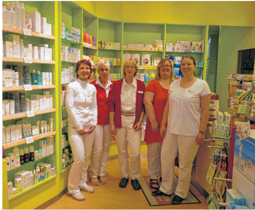
Das Team der Bären-Apotheke freut sich auf Ihren Besuch.

können sich ab sofort kostenfrei ein Styropor-Ei abholen und dieses bemalen, bekleben etc. Der Kreativität sind keine Grenzen gesetzt. Bis zum 16. März sollten die Eier zurückgegeben werden, denn es gibt schöne Dinge zu gewinnen.